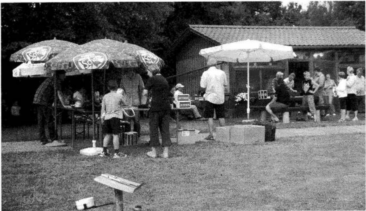
Das alljährliche zweitägige Besucherturnier des Miniatur-Golf-Clubs Ostheim lockte zahlreiche Hobbyspieler an die großflächige Anlage oberhalb der Kirchenburg.